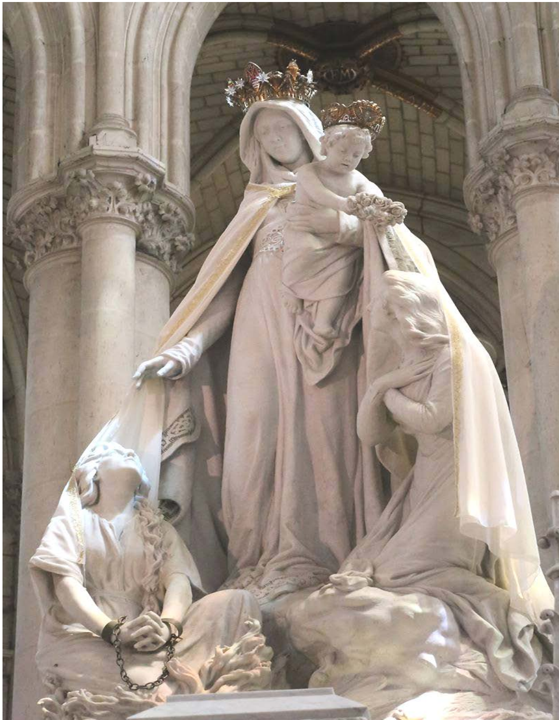
NOTRE DAME DE MONTLIGEON

Novembre Prions pour les âmes du Purgatoire